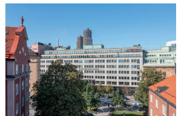
Elite Palace Hotel.